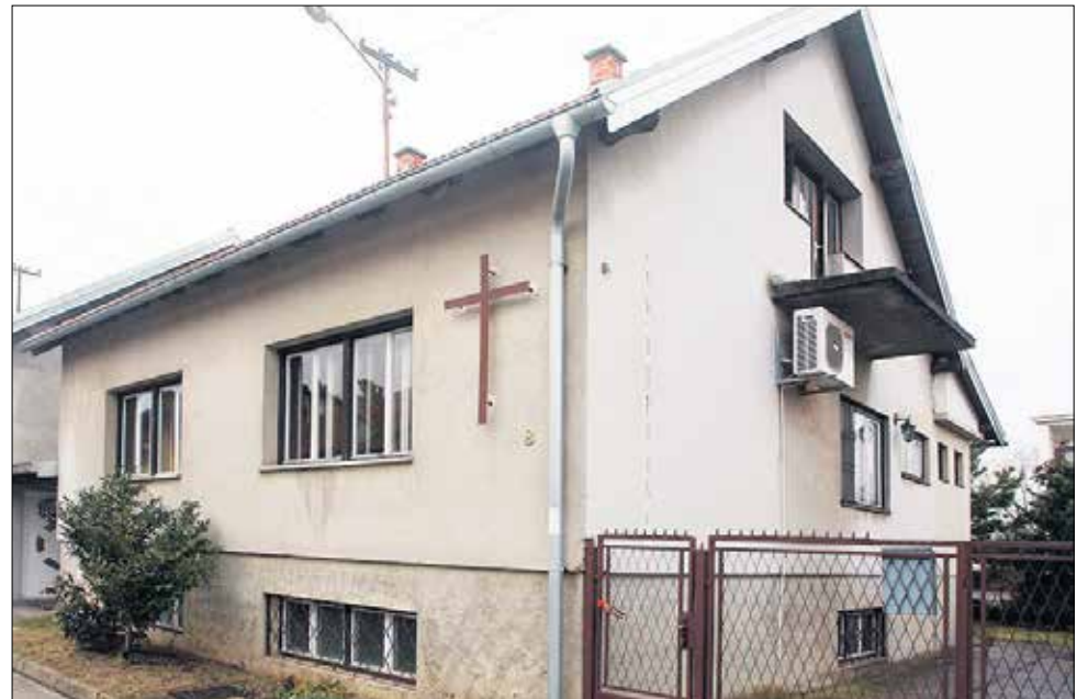
Svakog mjeseca se u Centru u organizaciji članica Franjevačkog svjetovnog reda prikuplja pomoć za potrebite

- Upornost otaca kapucina čiju je nakanu podržao i Nad-